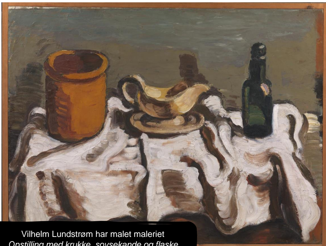
Vilhelm Lundstrøm, Opstilling med krukke, sovsekande og flaske, 1920, Statens Museum for Kunst